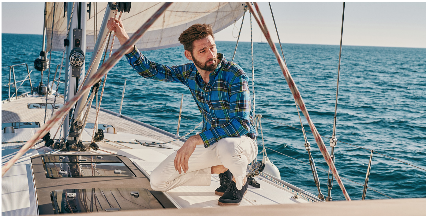
[Spain] Henry Cotton's #3 2022 S/S