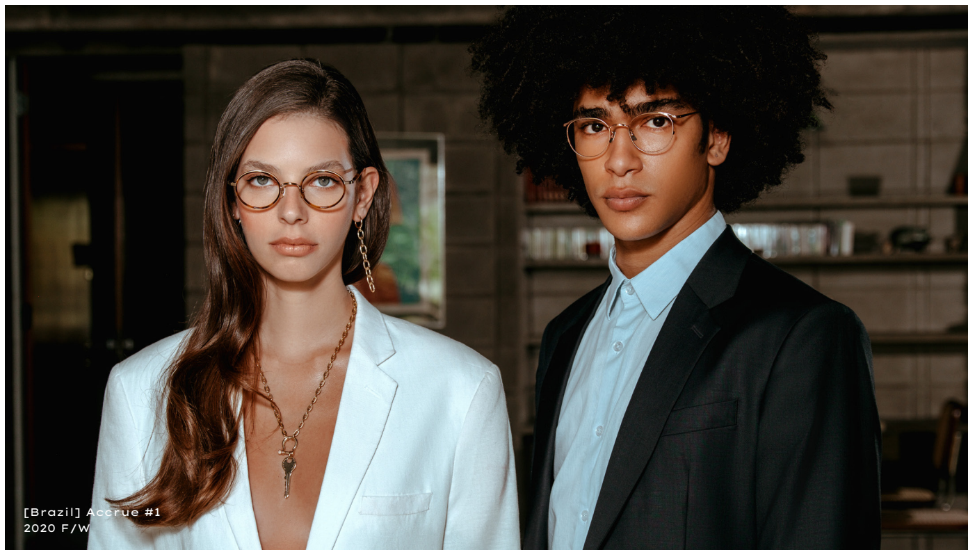
[Brazil] Acerue #1 2020 F/W