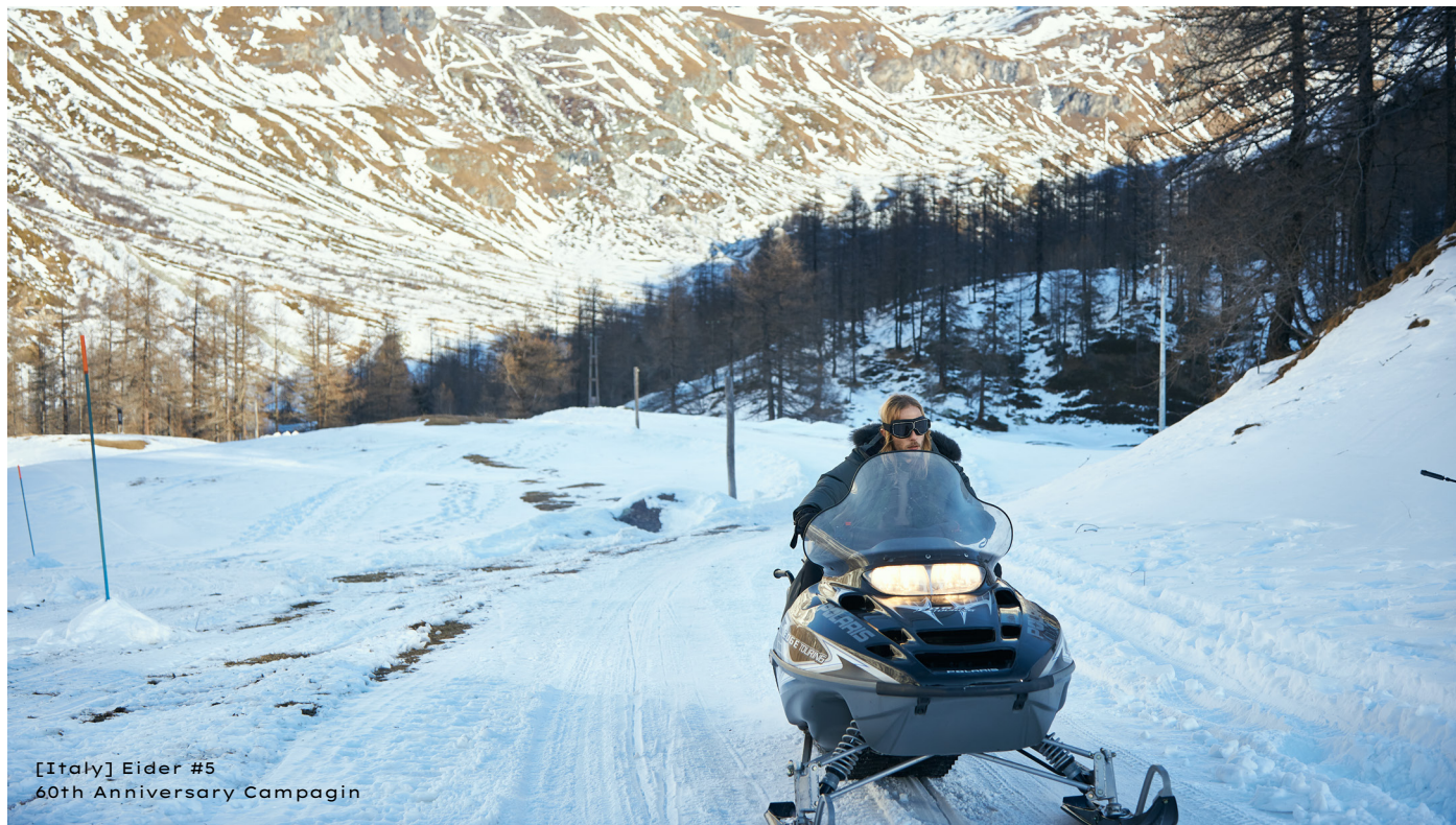
[Italy] Eider #5 60th Anniversary Campaign