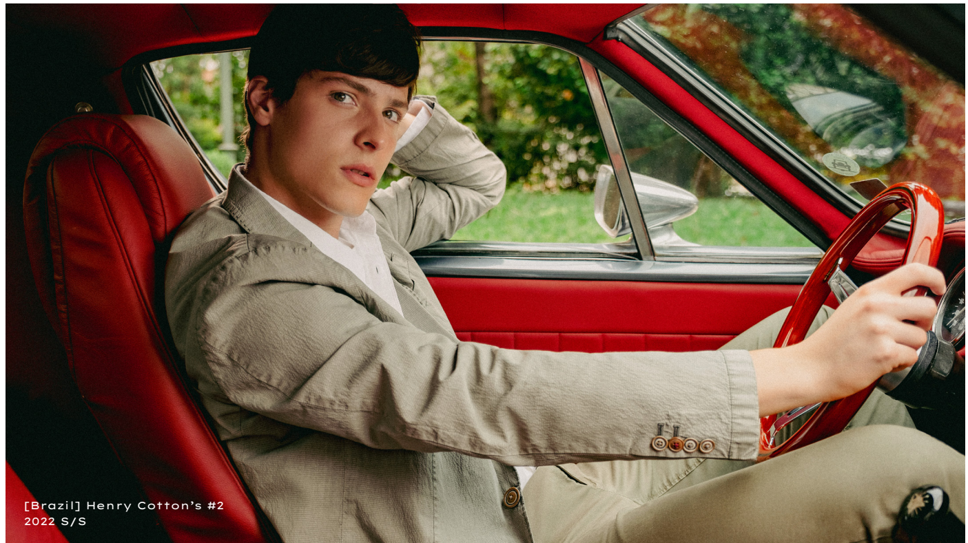
[Brazil] Henry Cotton's #2 2022 S/S